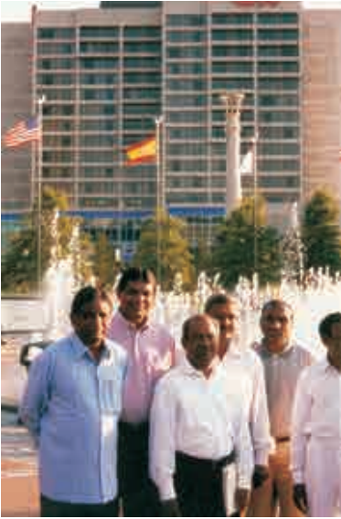
అట్లాంటాలో ఆటా, టిడిఎఫ్ కాన్ఫరెన్స్ - 2000