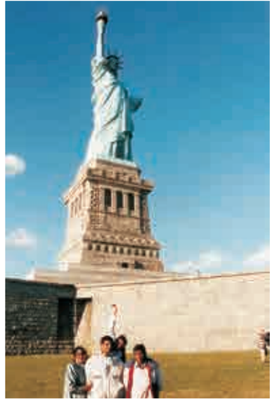
స్టాచ్యూ ఆఫ్ లిబర్టీ ముందు, న్యూయార్క్