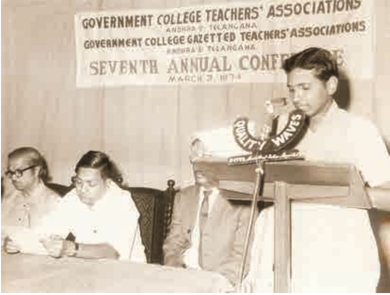
ఆంధ్రప్రదేశ్ గవర్నమెంట్ టీచర్స్ అసోసియేషన్ జనరల్ సెక్రటరీగా - 1974