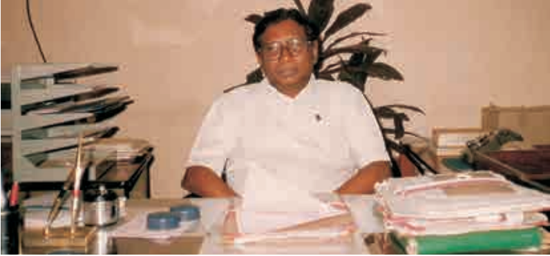
రిజిస్ట్రార్ సిఐఐఎఫ్ఎల్ (సిఫెల్) హైదరాబాద్ - 1990