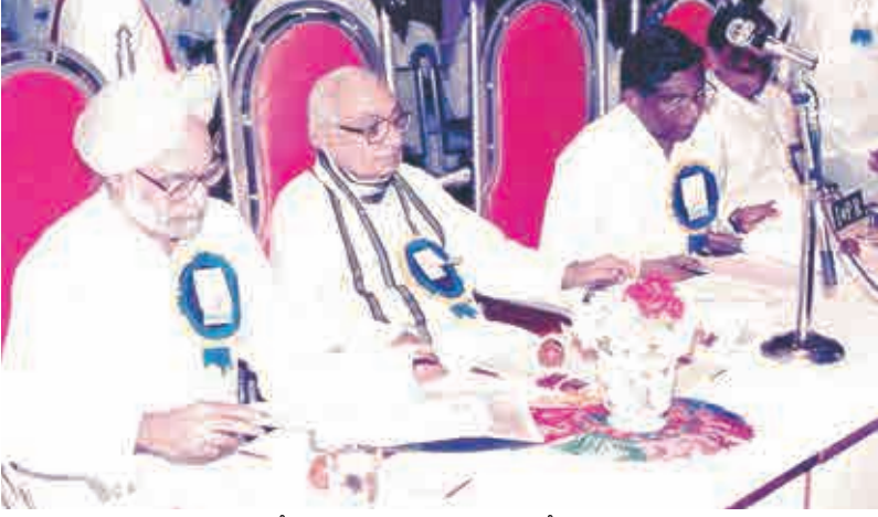
మన్మోహన్ సింగ్, కృష్ణకాంత్ లతో - 1992