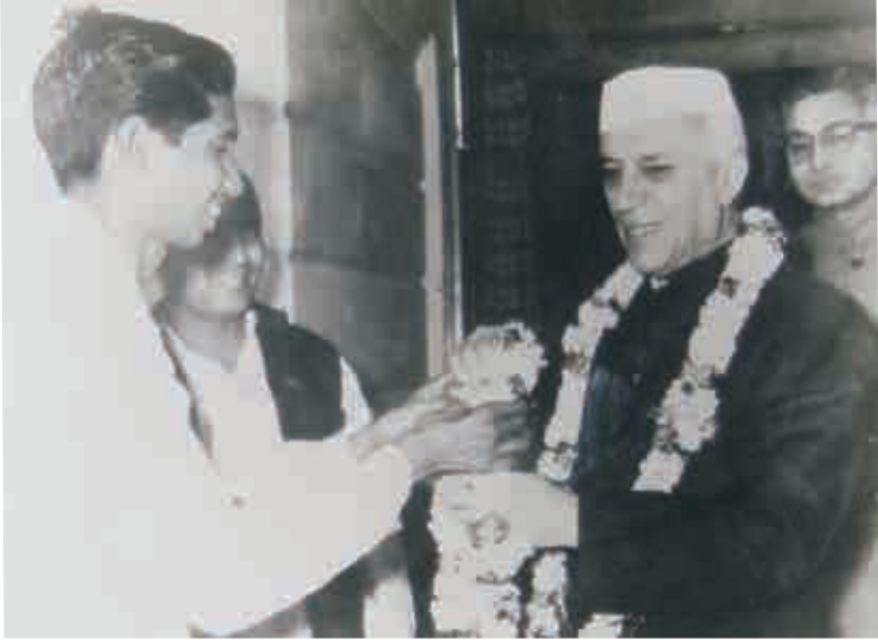
జవాహర్‌లాల్ నెహ్రూతో - 1959