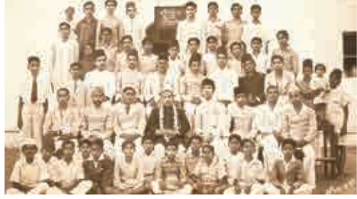
7వ తరగతి విద్యార్థిగా - 1947 (కూర్చున్న వారిలో కుడి నుంచి రెండవ బాబు)