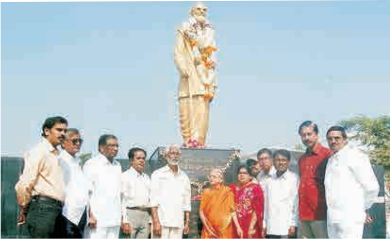
కాళోజి విగ్రహం ముందు నివాళులు అర్పిస్తూ - 2009