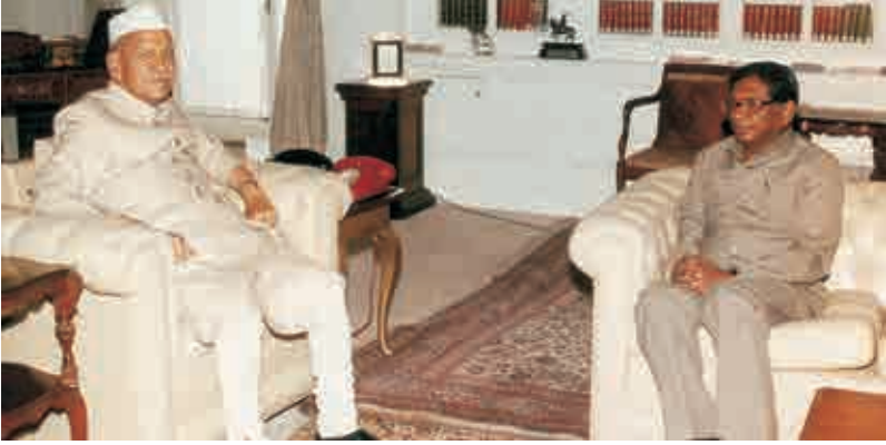
అప్పటి రాష్ట్రపతి శంకర్ దయాళ్ శర్మ - 1994