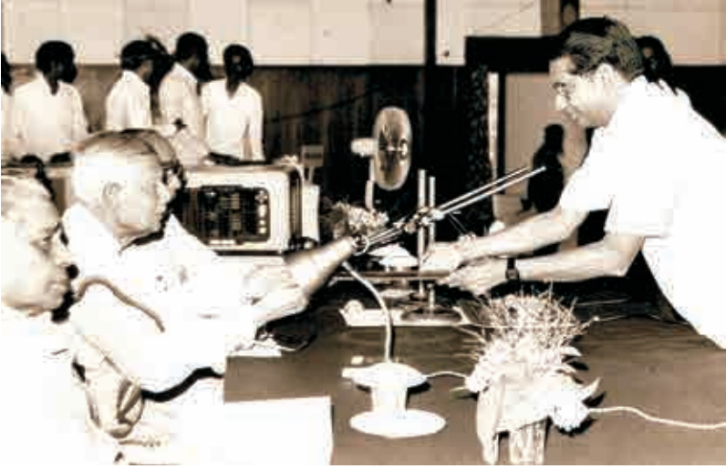
ఉస్మానియా యూనివర్సిటీలో పి.హెచ్.డి పట్టా తీసుకుంటూ