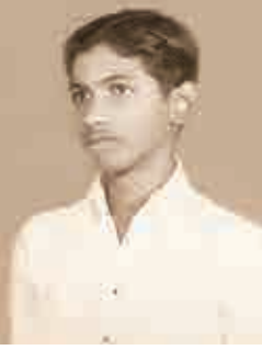
ఇంటర్ మీడియట్ విద్యార్థి - 1953