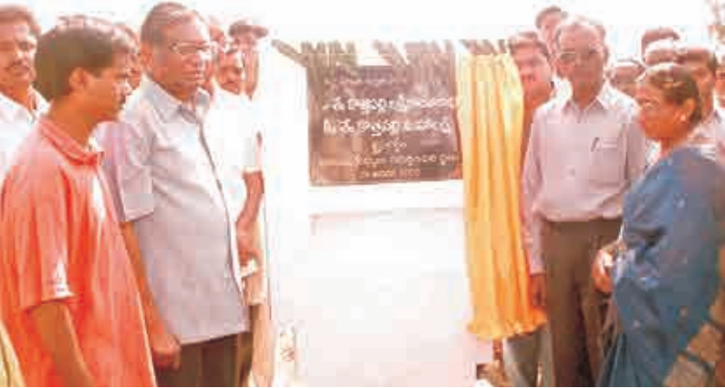
సొంత గ్రామం అక్కంపేటలో తల్లిదండ్రుల జ్ఞాపకార్థం స్కూల్ కోసం ఇచ్చిన స్థలం - 2002