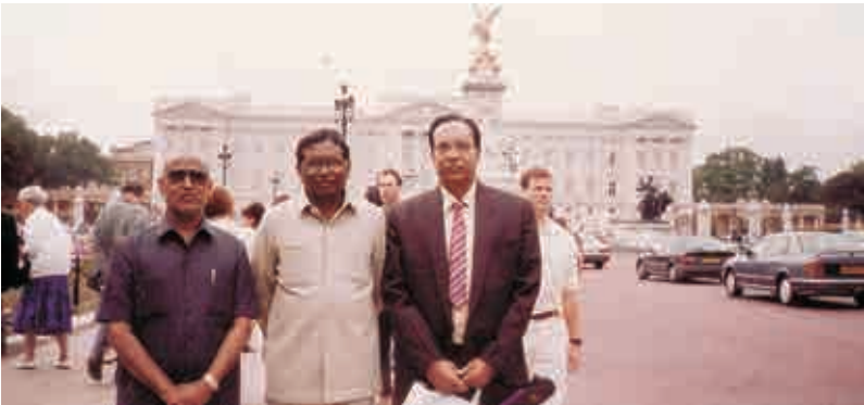
లండన్ లో బకింగ్ హాం ప్యాలెస్ దగ్గర