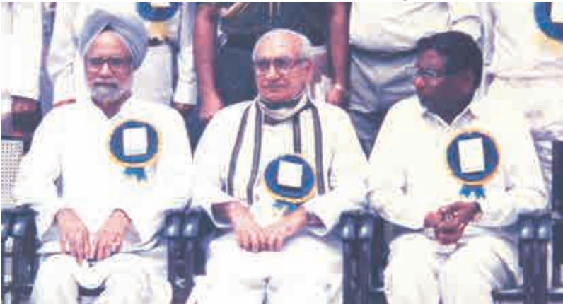
మన్మోహన్ సింగ్, కృష్ణకాంత్ లతో - 1992