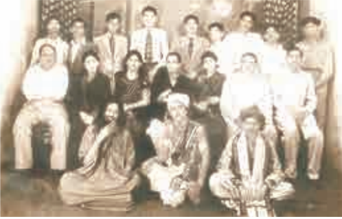
కాలేజ్ లో వేసిన నాటకంలో స్త్రీ వేషధారణ, మధ్య వరుసలో ఎడమ నుండి రెండవ వ్యక్తి - 1952