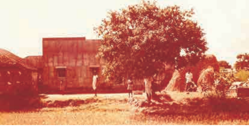
వరంగల్ జిల్లా అక్కంపేటలో పూర్వీకుల ఇల్లు