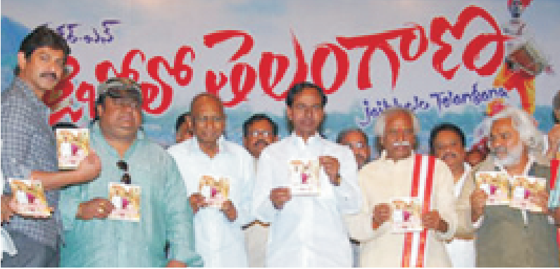
'జైబోలో తెలంగాణ' సినిమా ఆడియో రిలీజ్ ఫంక్షన్ లో