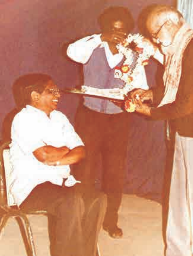
కాళోజి ఆశీస్సులు అందుకుంటూ - 1992