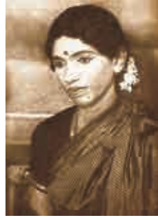
కాలేజ్ లో వేసిన నాటకంలో స్త్రీ పాత్రలో