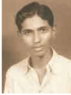
బి.ఎ విద్యార్థి, ఆర్ట్స్ కాలేజ్ ఓయు - 1954