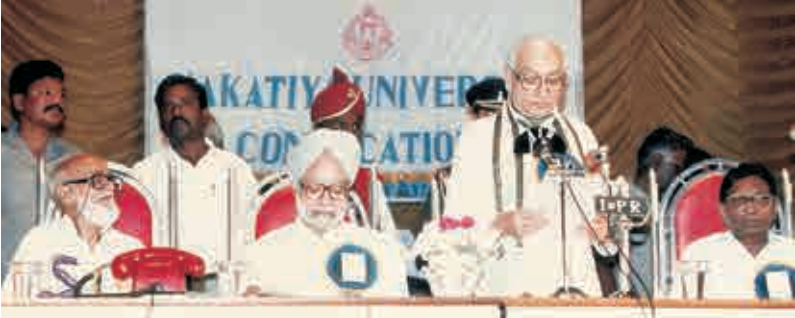
కాకతీయ యూనివర్సిటీ వైస్ ఛాన్సలర్ గా కాళోజి, మన్మోహన్ సింగ్, కృష్ణకాంత్ లతో - 1992