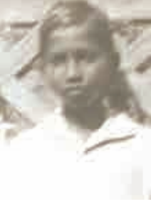
బాల్యంలో - 1942