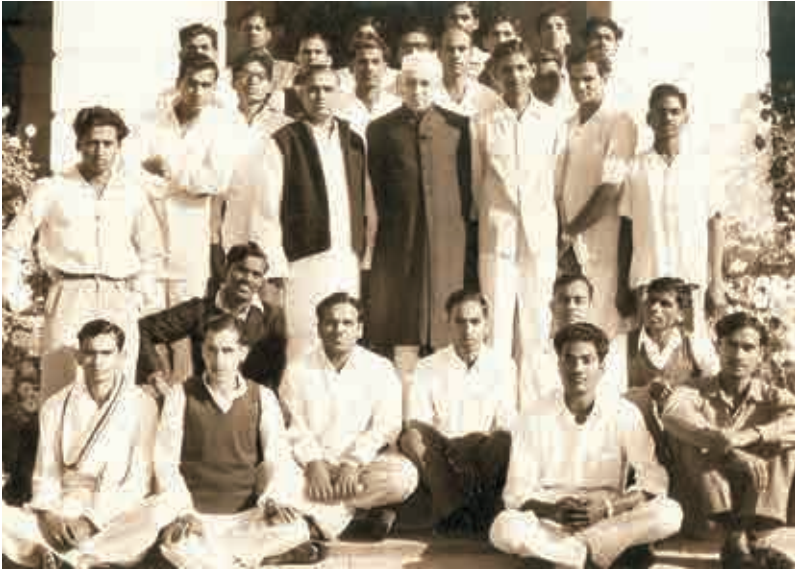
జవాహర్‌లాల్ నెహ్రూతో (ఎడమ వైపు) గ్రూప్‌ఫోటో