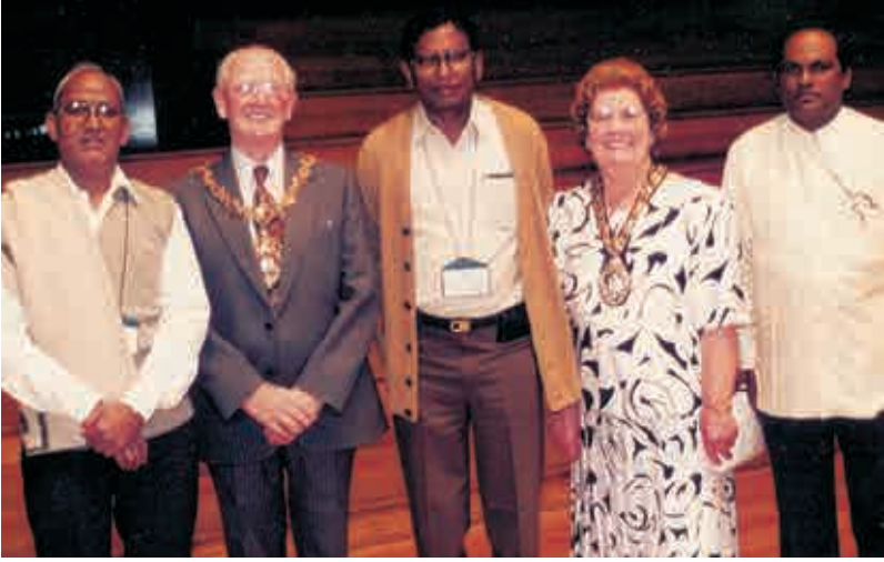
కామన్వెల్త్ యూనివర్సిటీల అసోసియేషన్ వి.సిల కాన్ఫరెన్స్లో యు.కె - 1993