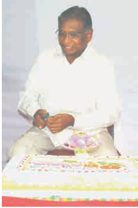
75వ జన్మదినం రోజు - 6-8-2009