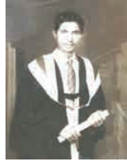
గ్రాడ్యుయేషన్ - 1956