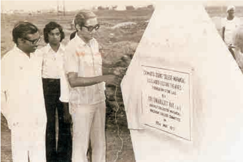
ఎస్. ఎస్. రేట్ సికెఎం కాలేజ్ ప్రిన్సిపల్ గా - 1977