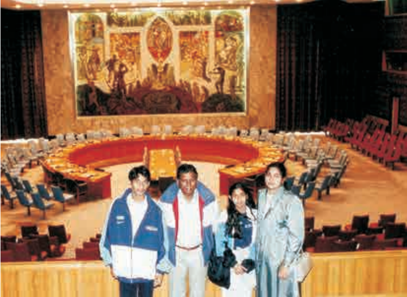
యుఎన్ సెక్యూరిటీ కౌన్సిల్ హాల్, న్యూయార్క్లో