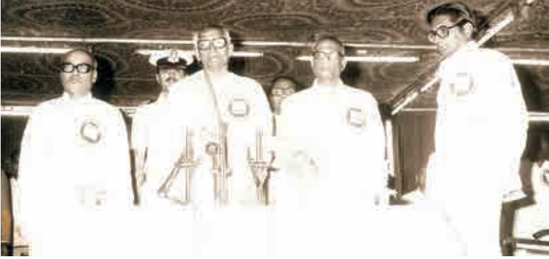
పి.వి. నరసింహారావుతో కాకతీయ యూనివర్సిటీ రిజిస్ట్రార్ గా - 1981