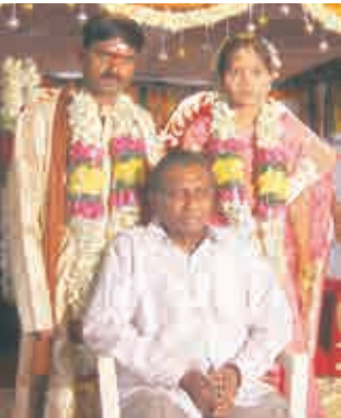
పెంపకంలో పెరిగిన పిల్లలు - 2005